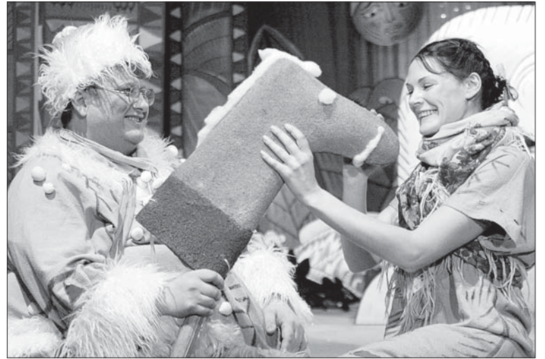
Совсем скоро «Морозко» поедет в Екатеринбург, на фестиваль «Коляда-plays».

В сентябре труппа театра ожидает открытие 77-го театрального сезона, премьеры спектакля «Таня-Та-