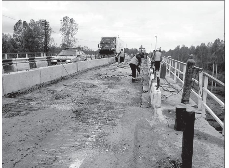
Работы на путепроводе в Болотнинском районе.

участке автодороги М-53 в Болотнинском районе (генеральный подрядчик — ОАО «Сибмост»). На днях специалисты субподрядной организации — ООО «Строительно-производственная фирма «Мост»